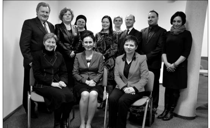
Dyrektorzy i kierownicy powiatowych jednostek pomocy społecznej.

11) dokonał zmian w budżecie Powiatu Wodzisławskiego na 2013 r.;