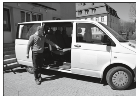
Stary samochód jest już wyeksploatowany i wymaga częstych napraw

Warsztat jest placówką dziennego pobytu dla 35 osób niepełnosprawnych, głównie intelektualnie i ruchowo. Jego celem jest rehabilitacja zawodowa i społeczna osób niepełnosprawnych, pod fachowym okiem instruktorów terapii zajęciowej, która umożliwi im zdobycie