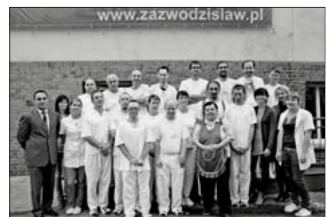
Pracownicy Zakładu Aktywności Zawodowej

Jeszcze całkiem niedawno niewielu mieszkańców powiatu wiedziało o istnieniu Zakładu Aktywności Zawodowej. Dziś to niezwykle przedsiębiorstwo, zatrudniające przede wszystkim osoby niepełnosprawne, stało się rozpoznawalną marką. Dzięki wysokiej jakości usług, Zakład notuje stałe wzrosty obrotów. – W roku 2012 ZAZ odnotował 105% wzrost w stosunku do roku 2011. Takie liczby pozwalają wysnuć wniosek, że Zakład, zatrudniający osoby niepeł-