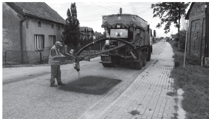
Naprawa remonterem drogowym nawierzchni jezdni ul. Mickiewicza w Lubomi

tacji na budowy chodników i przebudowy dróg. I tak nowa dokumentacja powstanie dla chodnika przy ul. Piaskowej w Gorzycach, ul. Wodzisławskiej w Rogowie oraz Orzyckiej w Czyżowicach. Z kolei w Lubomi powstanie dokumentacja dla przebudowy drogi 3545S (ul. Mickiewicza i ul. Korfantego), przebiegającej przez centrum tej miejscowości. W czerwcu oficjalnie zakończona została największa inwestycja drogowa powiatu w ostatnich latach, tj. przebudowa ciągu drogowego usprawniającego dojazd do stref przemysłowych w Czyżowicach i w Wodzisławiu Śl. oraz odciążającego DW 933, dzięki której na terenie gminy Gorzyce wyremontowano ul. Nową i ul. Wodzisławską. Koszt wynoszący ok. 7,8 mln zł w ponad 70% został sfinansowany ze środków unijnych.