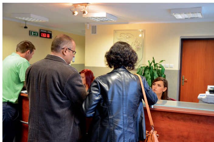
Obsługę Punktu Klienta w Wydziale Komunikacji i Transportu zapewnia dwóch pracowników

Ze względu na dużą liczbę obsługiwanych klientów, a także szeroki zakres zadań, jakimi zajmuje się Wydział, Starostwo podejmuje stale działania, mające na celu ułatwienie procesu załatwiania spraw w urzędzie. I tak każdy, kto chce zarejestrować pojazd lub załatwić inną – związaną z rejestracją – sprawę (np.