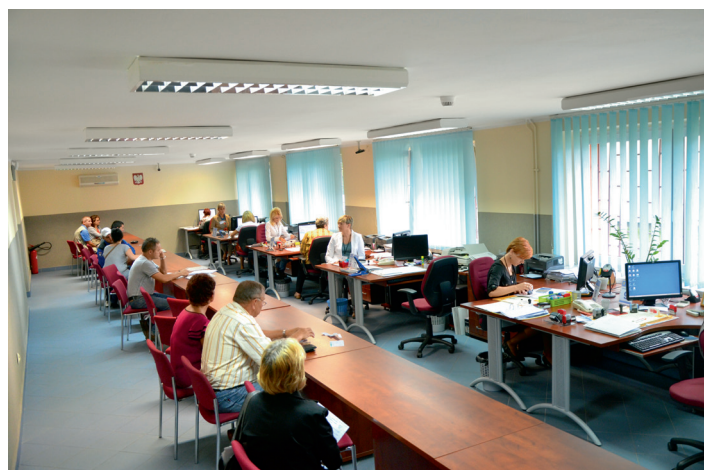
Na klientów chcących załatwić sprawy związane z rejestracją czeka 7 stanowisk

zgłoszenie zmian wymagających wymiany dowodu rejestracyjnego, wydanie wtórnika dowodu w związku z jego utratą), aby uniknąć oczekiwania w kolejkach może umówić się na wizytę na konkretny dzień i godzinę poprzez Internet. Wystarczy skorzystać z dostępnego na stronie internetowej Starostwa kalendarza wizyt , a następnie zgłosić się w Punkcie Obsługi Klienta w wyznaczonym terminie i powołać się na wcześniejsze ustalenia. Umówieni klienci traktowani są priorytetowo.