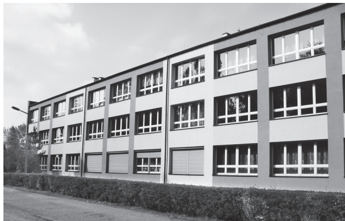
Siedziba Powiatowego Centrum Kształcenia Ustawicznego

Rozbudowa i modernizacja Powiatowego Centrum Kształcenia Ustawicznego ma na celu poprawę warunków kształcenia ustawicznego poprzez stworzenie nowoczesnych i specjalistycznych warsztatów oraz pracowni zawodowych. Utworzony obiekt ma być odpowiedzią na konieczność rozwijania oferty edukacyjnej placówek kształcenia ustawicznego jako elementu wspomagającego przeciwdziałanie niekorzystnym zmianom na rynku pracy. W ramach inwestycji powstaną nowoczesne warsztaty obróbki mechanicznej - klasycznej, hala obrabiarek CNC, spawalnia, hala