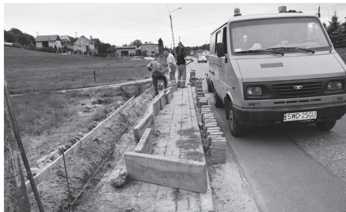
Remont chodnika przy ul. Centralnej w Połomi

Także w Syryni zostanie zmodernizowany chodnik przy ul. 3 Maja, a w Turzy Śl. powstanie chodnik i kanalizacja deszczowa przy ul. Mszańskiej. W przypadku gminy Gorzyce i gminy Lubomia znaczne środki zostaną wydatkowane na opracowanie dokumen-