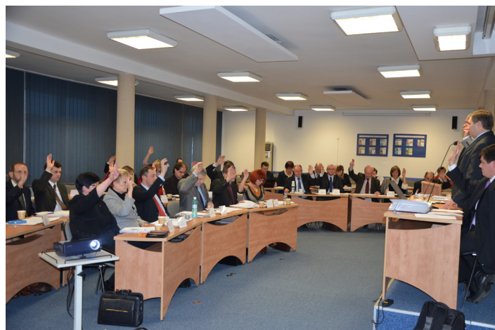
Obrady styczniowej sesji Rady Powiatu Wodzisławskiego

Zakładu Aktywności Zawodowej – Zakładu Usług Gastronomicznych w budynku przy ul. Wałowej 30 w Wodzisławiu Śl.”.