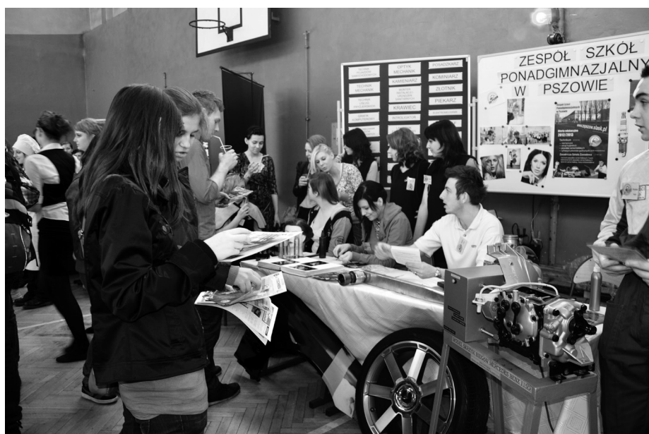
Gimnazjaliści podczas targów mogli zapoznać się z bogatą ofertą szkół ponadgimnazjalnych

logistyk, technik geodeta w ZSP Nr 2 w Rydułtowach oraz technik cyfrowych procesów graficznych w ZSP w Pszowie. Liceum Ogólnokształcące w Rydułtowach proponuje w klasie pierwszej wprowadzenie innowacji: „edukacja policyjna”, „animacja kultury” i „ratownictwo medyczne i pożarnictwo”. Utrzymano także nabór do Liceum Plastycznego w Zespole Szkół Ponadgimnazjalnych w Wodzisławiu Śl., a także do klasy mundurowej w I Liceum Ogólnokształcącym w Wodzisławiu Śl.