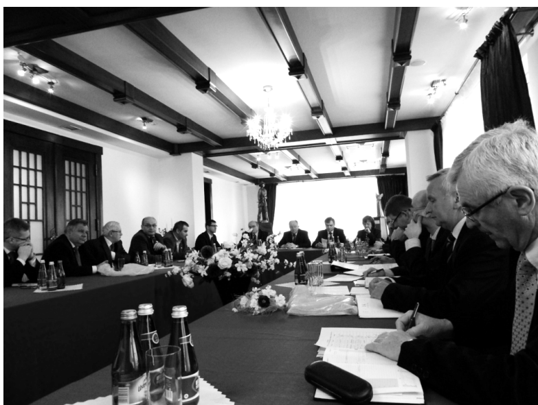
Obrazy włodarzy miast i gmin podczas Konwentu Miast i Gmin Powiatu Wodzisławskiego

Na zakończenie Starosta wystąpił z propozycją, aby jeden z najbliższych konwentów poświęcić omówieniu sytuacji na lokalnym rynku pracy i ustaleniu polityki inwestycyjnej gmin, deklarując równocześnie ścisłą współpracę z gminami w tym temacie.