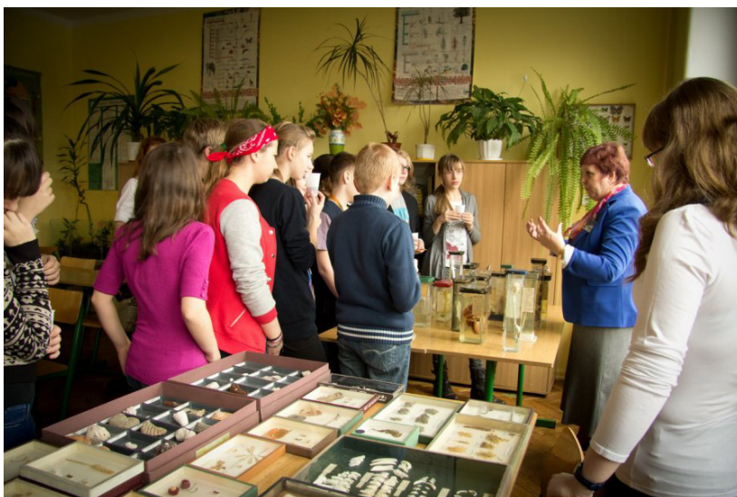
Przyjemne z pożytecznym czyli interaktywne zajęcia podczas Festiwalu Nauki „Mali Odkrywcy”

Wydawca: Starostwo Powiatowe w Wodzisławiu Śląskim, Wodzisław Śląski, ul. Bogumińska 2. Nakład: 2500 egz.