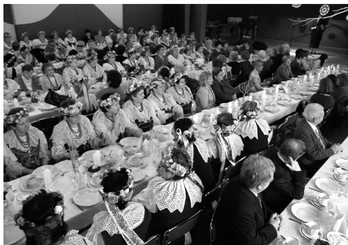
Gorzyckie gospodynie na corocznym wiosennym świętowaniu