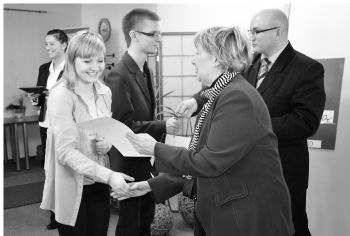
Podczas spotkania wręczono nagrody laureatom powiatowych eliminacji do Ogólnopolskiego Konkursu Recytatorskiego