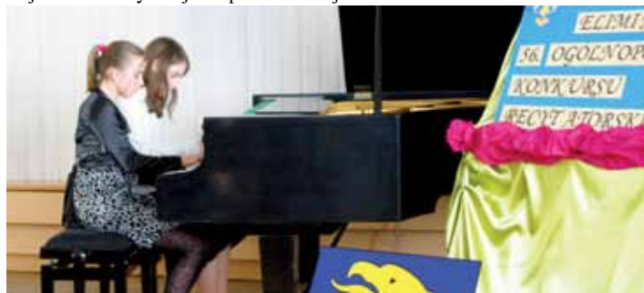
Występ uczniów Państwowej Szkoły Muzycznej podczas Koncertu Laureatów

Koncert laureatów oraz wręczenie nagród odbyło się 30 marca w Państwowej Szkole Muzycznej I stopnia im. Wojciecha Kilara w Wodzisławiu Śl.