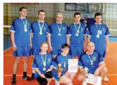
Zwycięska drużyna Starostwa Powiatowego w Wodzisławiu Śl.

Turniej był doskonałą okazją do zrelaksowania się na parkiecie po tygodniu pracy. Po obu stronach siatki jednak nikt nie odpuszczał i toczyła się zacięta walka o każdy punkt. Drużyny zostały podzielone na dwie grupy,