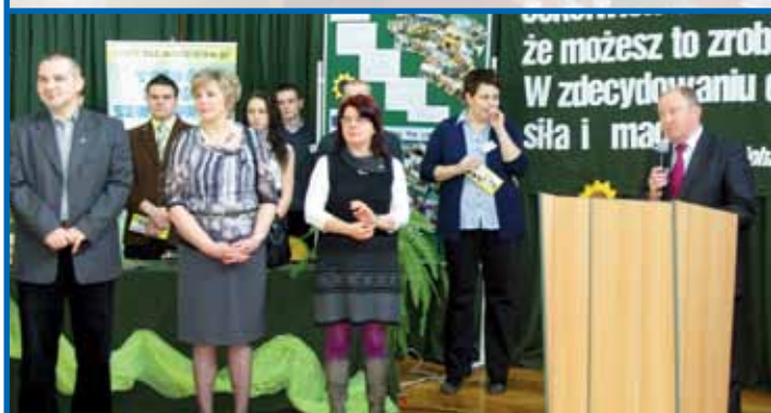
Powiatowe Targi Edukacyjne - czytaj str. 9