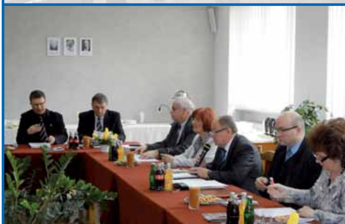
II Konwent Miast i Gmin Powiatu Wodzisławskiego - czytaj str. 7