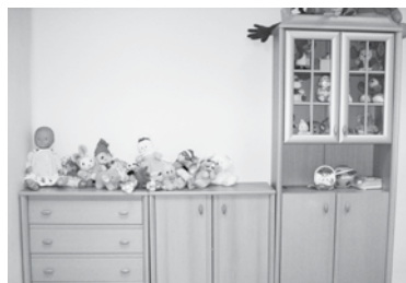
Jedno z pomieszczeń Powiatowego Ośrodka Wsparcia dla Ofiar Przemocy.

Ośrodek prowadzi grupę korekcyjno – edukacyjną dla osób stosujących przemoc. Oddziaływanie korekcyjno – edukacyjne polegają na opracowaniu planu pracy ze sprawcą przemocy, którego celem jest uświadomienie osobie