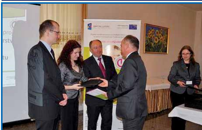
Projekt „Impuls do zmian” - czytaj str. 9