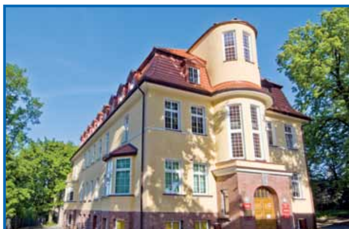
Wspieramy Ofiary Przemocy w Rodzinie - czytaj str. 5

Życzenia wszelkiej pomyślności z okazji Świąt Wielkanocnych składają wszystkim mieszkańcom powiatu wodzisławskiego Zarząd i Rada Powiatu Wodzisławskiego