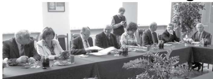
Uczestnicy II Konwentu Miast i Gmin Powiatu Wodzisławskiego.

W dalszej części posiedzenia wóldarze podjęli dyskusję dotyczącą funkcjonowania komunikacji publicznej na terenie powiatu w świetle nowej ustawy o publicznym transporcie zbiorowym. Starosta, jak i pozostali uczestnicy konwentu podkreślili, że nakłada się na samorządy co raz to nowe zadania, nie przekazując żadnych środków. Omówiono sytuację panującą w poszczególnych gminach. Odniesiono się także do przewidywanej całkowitej likwidacji PKS w Rybniku, co ma ogromne znaczenie zwłaszcza dla południowo - zachodnich gmin powiatu. Wóldarze gmin z oburzeniem wskazywali na praktyki kierownictwa rybnickiego PKS, polegające na likwidacji kolejnych kursów bez wcze-