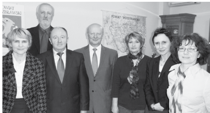
Nowa Powiatowa Społeczna Rada ds. Osób Niepełnosprawnych.