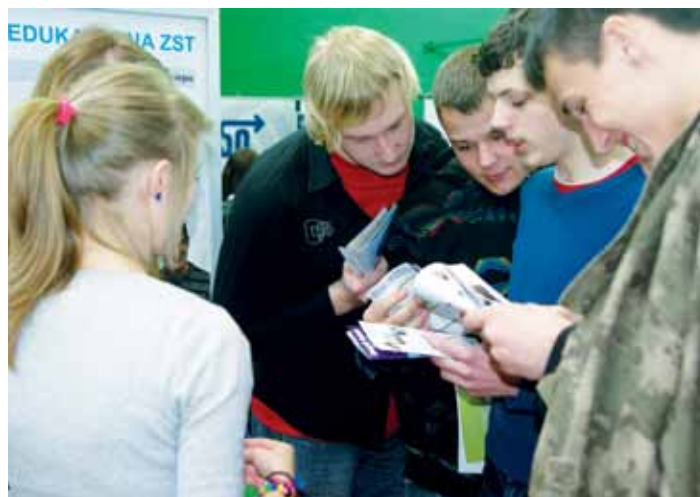
Uczestnicy Targów Edukacyjnych.

Z tego powodu w tym roku Powiat planuje w swoich szkołach uruchomić dla absolwentów gimnazjów 56 klas (oddziałów) kształcących w około 50 kierunkach. Wszyscy, którzy marzą o pracy w wojsku, policji, straży pożarnej czy straży granicznej, po raz pierwszy uzyskują możliwość kształcenia się w klasach mundurowych. Powiat Wodzisławski czyni też starania na rzecz uruchomienia od września br. czteroletniego Liceum Plastycznego w Wodzisławiu Śl. W Zespole Szkół Zawodowych w Wodzisławiu Śl. kon-