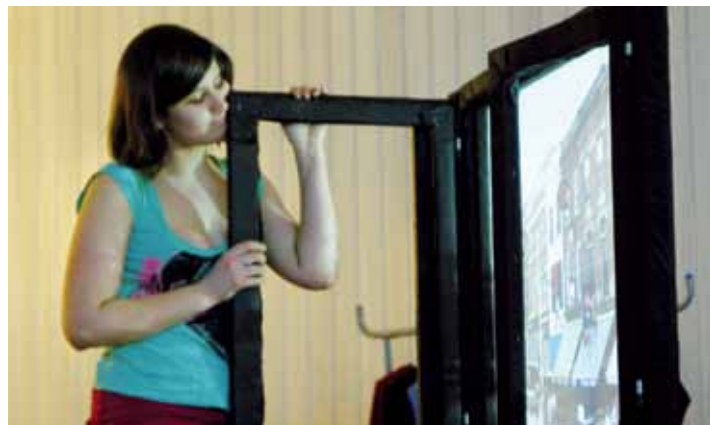
Powiatowe eliminacje do 56. Ogólnopolskiego Konkursu Recytatorskiego

16 marca 2011 r. w Państwowej Szkole Muzycznej I stopnia im. Wojciecha Kilara odbyły się powiatowe eliminacje do 56. Ogólnopolskiego Konkursu Recytatorskiego.