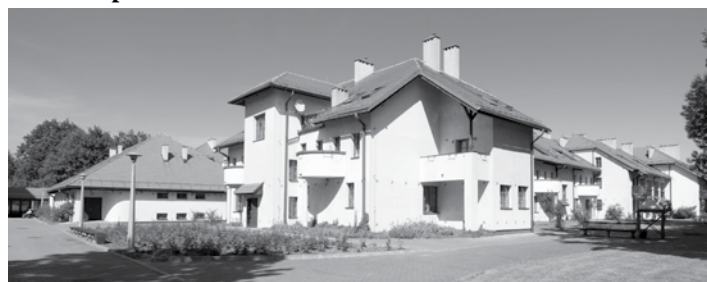
Dom Pomocy Społecznej im. Papieża Jana Pawła II w Gorzycach.

Każdy człowiek marzy o spokojnej i szczęśliwej starości. Co jednak zrobić, kiedy choroba, niepełnosprawność uniemożliwiają samodzielne funkcjonowanie, uzależniają nas od opieki innych? Wtedy warto się zastanowić nad tym, kto może się nami zaopiekować.